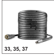
33, 35, 37