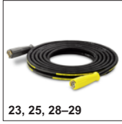
23, 25, 28-29