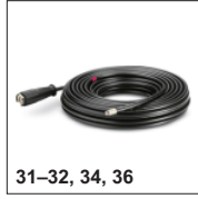
31-32, 34, 36